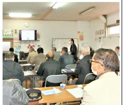
熱心に活動の様子や、実践報告を聞く参加者