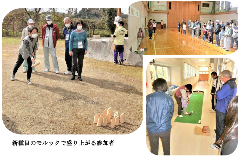
新種目のモルックで盛り上がる参加者

発行 お問い合わせ先 草間市民センター 草間公民館 ☎ 74 - 9001 FAX 74 - 9000