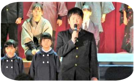
一生懸命に演技やあいさつをする児童