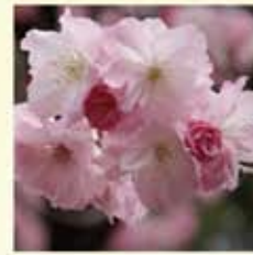
ベニユタカ(紅豊) 大輪八重咲で芳香あり