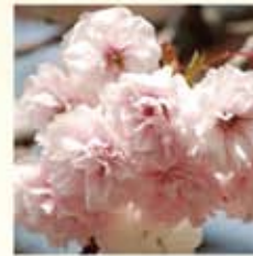
フゲンソウ(普賢象) 雄しべが象に似ている