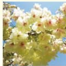
ウコン(鬱金) 淡黄緑色の太輪八重咲