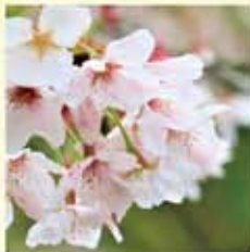
ソメイヨシノ(梁井吉野) さくらの開花予想でおなじみ