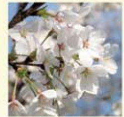
サクヤヒメ(咲耶姫) 5枚の花弁が二重三重に