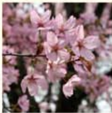
オオヤマザクラ(大山桜) 葉と同時に開花。一重咲き