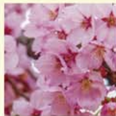
ヨウコウ(陽光) 紅紫色で下向きの一重咲き