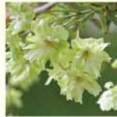
ギョイコウ(御衣黄) 中輪八重咲。花の色が変化