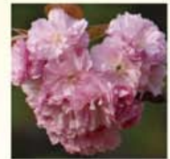
カンザン(関山) 大輪八重咲。塩漬けできる