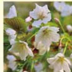
オオシマザクラ(大島桜) 5枚の花弁に切れ込み