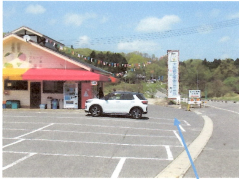
大原観光果樹園 (トイレあり)