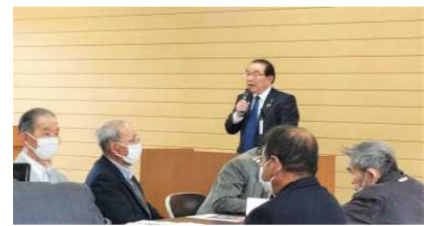
戎市長の市政報告