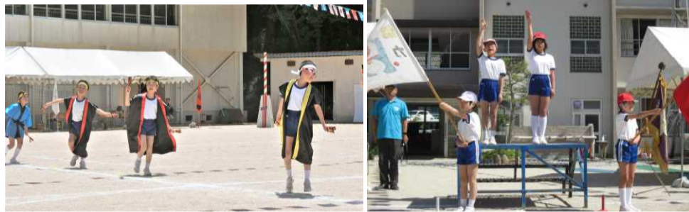
はつらつとした演技

特に小学校4・5年生の児童は、演技だけでなく、その前後の準備や片付け、演技中の進行・放送など、それぞれの役割を一生懸命頑張る姿に成長を感じました。先生や保護者も含め、全員で作りに上げた一体感のある小規模校ならではの良さに触れた感動の運動会でした。