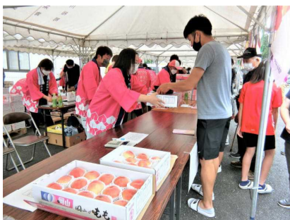
昨年のもも直売まつり