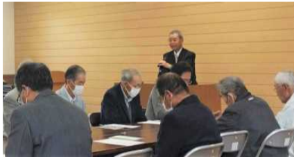
藤野会長のあいさつ