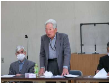
西山会長のあいさつ

この日も総会前に、輪投げゲームで楽しく身体を動かしました。また総会後は、会食を行い、会員相互の親睦と交流が図られました。