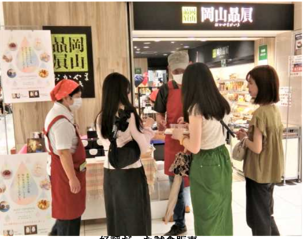
好評だった試食販売