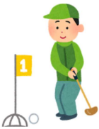
成績は次のとおりです。

8月20日(火)、土橋交流センターグラウンドにおいて、草間台グラウンドゴルフ愛好会の8月大会が、会員25名の参加で行われました。