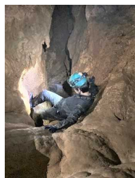
探検の様子と鍾乳石

私が岡山県内の洞窟で特に記憶に残っているのが新見市哲多町にある護王の穴です。地権者の方に許可を頂くことで入洞することが出来ます。この洞窟の特徴としては洞窟を探検している感覚を強く感じることが出来ます。また鍾乳石なども多く見られ、景色も申し分ないです。この洞窟は分かれ道が比較的少なく道に迷う心配もほとんどないので、少し洞窟探検に慣れてきた方なら十分に楽しめるでしょう。難易度の洞窟です。まだ行くことのできていない岡山県内の洞窟が多数あるので、いつか行けたらなと思いいます。