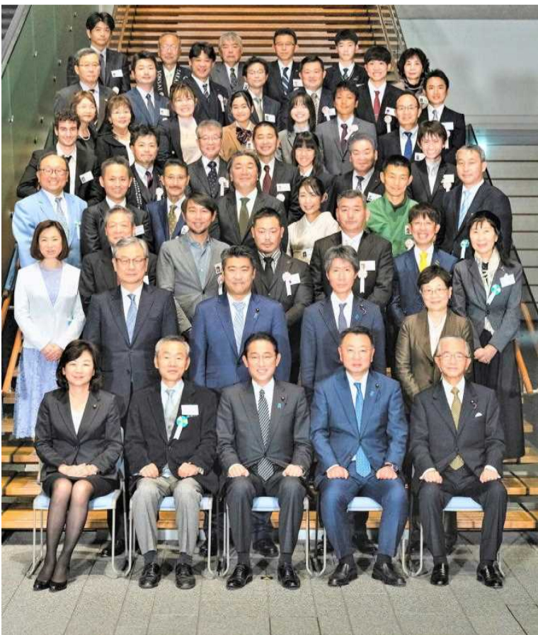
総理官邸での記念写真(前列中央に岸田総理)