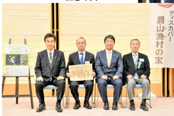
左から、赤池内閣府副大臣、西村事務局長(草間台エコミュージアム推進協議会)、下野農林水産大臣政務官、林座長(有識者懇談会)