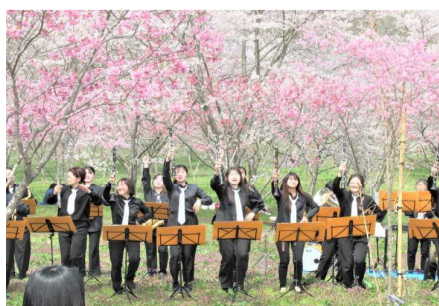
新見ウインドアンサンブルによる演奏