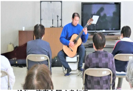
ギター演奏を聞く参加者

この後、参加者は、ソメイヨシノが満開を迎えていた「羅生門さくら公園」にお花見に行き、美しい桜の下で、お花見弁当を広げ楽しい時間を過ごし、親睦を深めていました。