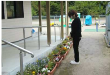
草間台保育所のプランター