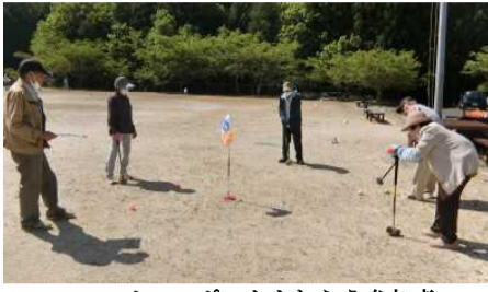
ホールポストをねらう参加者