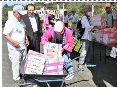
飛ぶように売れた桃

また会場では草間産の夏野菜、おこわ、焼きそば、焼き鳥などの他、草間産のそば粉を使用したざるそばも人気を集めていました。毎回恒例の新見ウインドアンサンブルの吹奏楽や、みんなも登場したダンスチームDELIGHTも会場を大いに盛り上げていました。