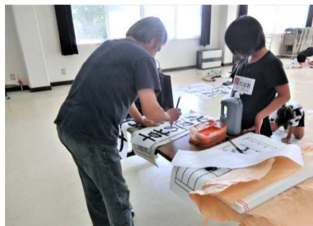
先生から教わる様子