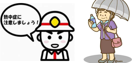
熱中症に注意しましょう!